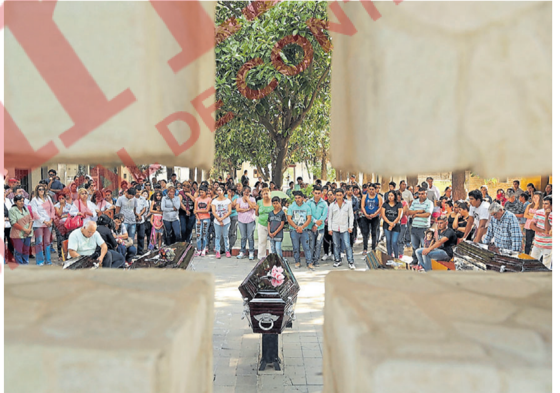
Tragedia. El entierro de Nancy y sus cuatro hijos, asesinados por su concubino 24 años mayor.

"La violencia aparece muchas veces en este tipo de relaciones con tanta diferencia de edad", afirma Bianco. Una prueba es que la Oficina de Violencia Doméstica (OVD) de la Corte Suprema desde 2009 hasta el año pasado recibió 197 denuncias de menores de 18 contra sus concubinos, esposos o ex parejas. Entre ellas hubo un caso de una niña de 14 años. Una niña esposa de la Ciudad de Buenos Aires.