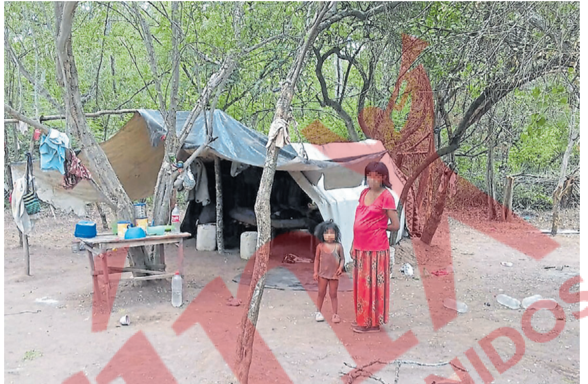
Embarazo adolescente. En comunidades salteñas denuncian un aumento de "niñas esposas".