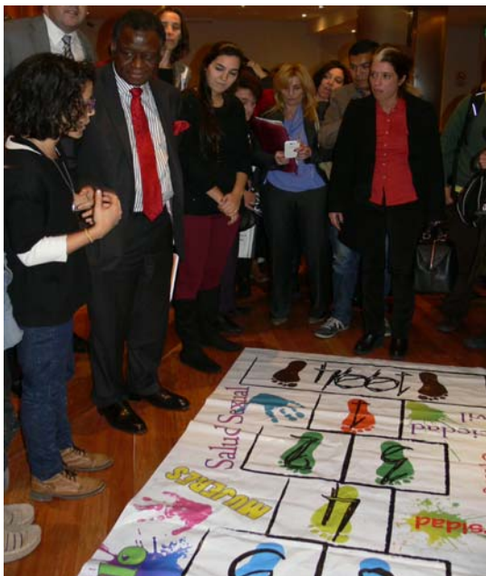
Jóvenes de Argentina explican el juego de la Rayuela al director ejecutivo del UNFPA, Babatunde Osotimehin, durante su visita a Buenos Aires.

La forma de avanzar en el juego es respondiendo las trivias sobre derechos sexuales y reproductivos, que